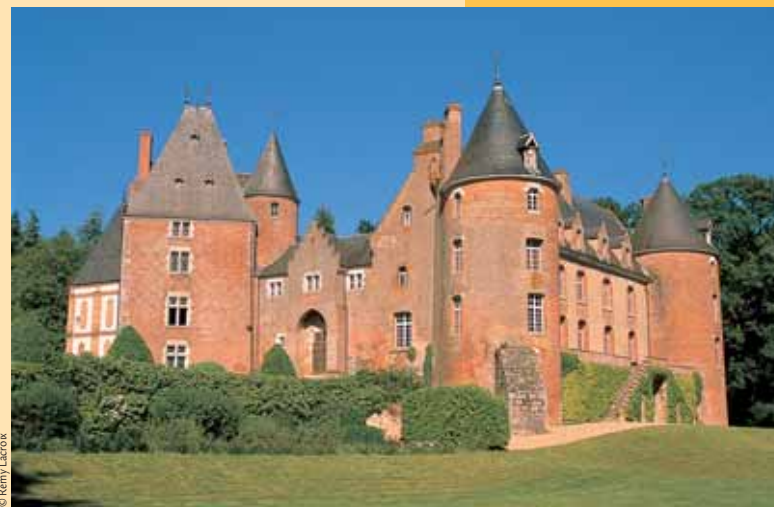
Le château de Blancfort sur la route Jacques-Cœur.