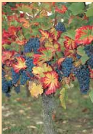
Prix : 1,00 €

Le vignoble de Menetou-Salon produit des vins blancs secs de cépage sauvignon ainsi que des rouges et des rosés issus du pinot noir.