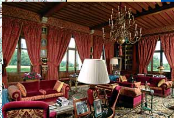
Le château d'Arenberg à Menetou réunit tous les attributs d'une demeure princière de la Belle Époque.

Ainsi, dans le vaste parc arboré, les anciennes écuries abritent-elles une riche collection de voitures anciennes.