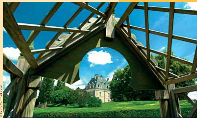
Le château de Menetou-Salon vu du parc.