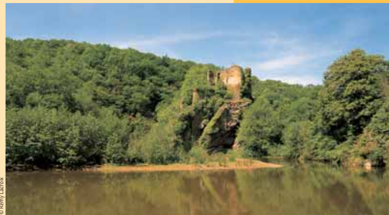
Le château de La Roche-Guillebaud domine l'Arnon.

ATTENTION ⚠ quelques passages difficiles