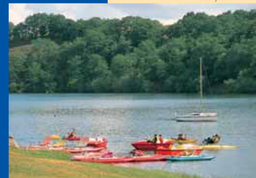
La base nautique du lac de Sidaillies.

Encore debout à l'extrémité sud du lac, les vestiges solitaires de la forteresse de La Roche-Guillebaud nous ramènent au XII e siècle où est faite la première mention du château. En 1188, La Roche-Guillebaud est assiégée et prise par Philippe Auguste. Elle dépendait jusqu'alors du roi d'Angleterre. Plusieurs fois reconstruit, le château est acheté en 1610 par Sully et définitivement abandonné depuis le XVII e siècle.