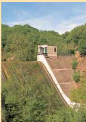
Le barrage des Chetz.